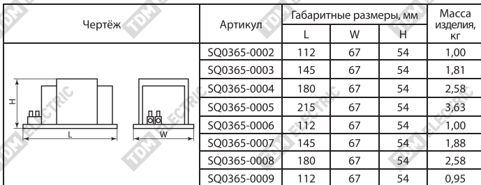
Таблица 2. Габаритные и установочные размеры

2.2. Габаритные и установочные размеры представлены в таблице 2.